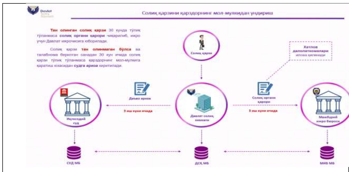
2-rasm Solix qarzini qarzdorligining mol-mulkidan undirish

Agar qarzdor belgilangan muddatda talabnomaga nisbatan o'z e'tirozini bildirmasa, ushbu qarzdorlik tan olingan, boshqa holatlardan tan olinmagan hisoblanadi. Talabnoma yuborish bilan bir vaqtda qarzdorning bankdagi hisob varaqlariga inkasso topshiriqnomasi, jumladan valyuta hisob raqamlariga talabnoma yuboriladi. Yuqoridagi undiruv choralari qo'llanilgandan keyin ham soliq qarzi soliq to'lovchi tomonidan to'lab berilmasa. Tan olingan soliq qarzi bo'yicha soliq organi qarori Majburiy ijro byurosiga yuboriladi. Tan olinmagan qismiga esa sudlarga ariza kiritiladi (2-rasm).