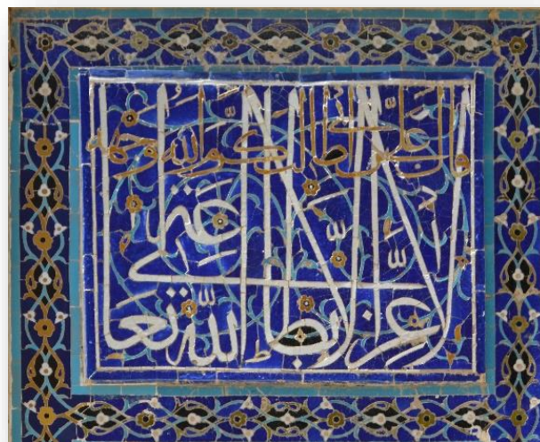
3-расм. Хаттотлик ва Ислимий нақшли меъморий безак

Калиграфик - ёзувнинг ривожланиши билан безакларга нафақат тасвирлар, балки ҳарфлар ҳам қўшила бошланди. Ҳатто саводсиз ҳунармандлар ҳам кўпинча ўз маҳсулотларини тушунарсиз белгилар билан безашган, улар алифбодан машаққатли равишда кўчириб олишган. Ушбу турдаги декор Шарқ ва араб мамлакатларида айниқса кенг тарқалган. Калиграфик безаклар нақш ва ритмда ифодаланган алоҳида ҳарфлар ёки матн элементларидан иборат. Хаттотлик санъати Хитой, Япония каби мамлакатларда, бир қатор араб мамлакатларида маълум маънода тасвирий санъат ўрнини босган ҳолда кенг ривожланган. Калиграфик нақшлар кўпинча геометрик ва гулли элементлар билан мураккаб комбинацияда пайдо бўлади.