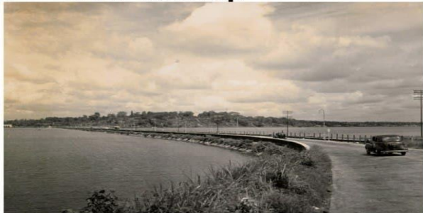
25 май 2015 йил