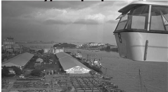
11 май 2015 йил